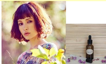
NOMAさん (モデル) アロマセラピー検定1級