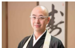
川野泰周先生(禅僧・精神科医)