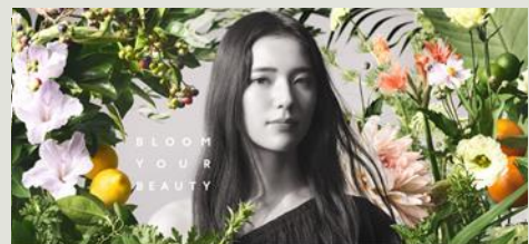
ナチュラルビューティスタイリスト検定