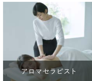
アロマセラピスト

プロのアロマセラピストとして、一般の方にアロマトリートメントやコンサルテーションを実践できる能力を認定する資格です。