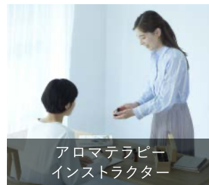
アロマセラピー インストラクター

アロマセラピー教育のスペシャリストとして、安全なアロマセラピーの実践方法を一般の方に教授できる能力を認定する資格です。