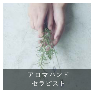
アロマハンド セラピスト

安全にアロマセラピーを行うための知識を持ち、第三者にアロマハンドトリートメントを提供できる能力を認定する資格です。