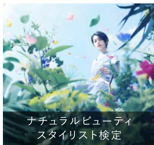
ナチュラルビューティ スタイリスト検定

植物のチカラを学び、旬の野菜やハーブ、睡眠や呼吸法などのカラダの内側からのケア、スキンケアやヘアケアなどカラダの外側からのケアに取り入れて、美しく健康的に輝く人を目指すための検定です。