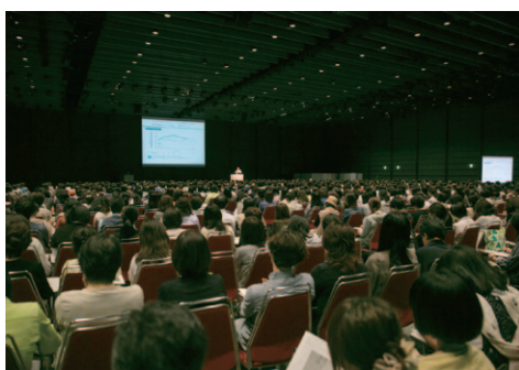
満席のセミナー会場。

アロマテラピーを認知症予防に活用するときは、決められた量や時間を守り、使用方法に従うことが重要です。昼は移動しても精油の香りが届くようにアロマペンダントを使い、夜は置き型タイプデバイフューザーを寝室に置くことをおすすめしています。適量を使用しましょう。