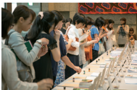
セミナー会場の入口に精油のテスターを設置しました。